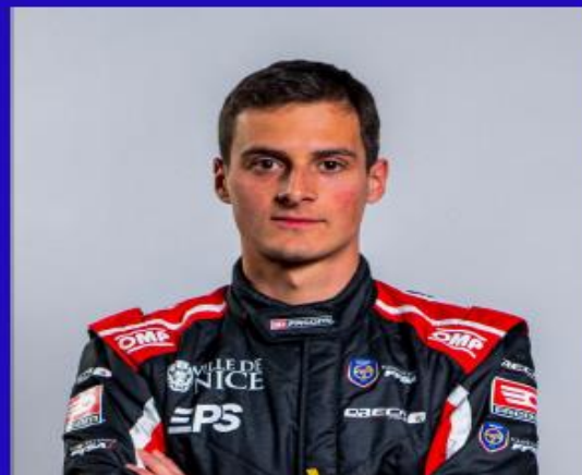
immagine profilo Facebook

2023: 1° classificato Rallye Le Touquet - Pas-de-Calais