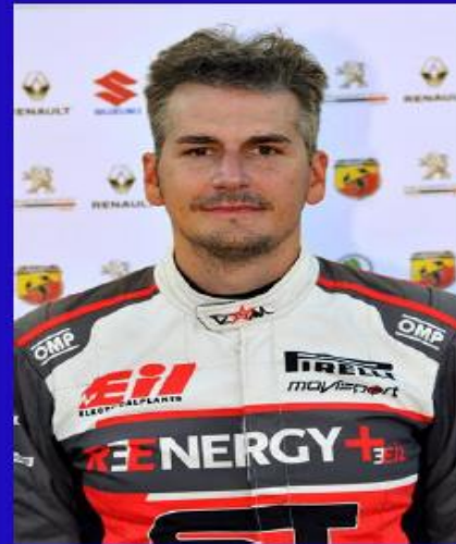
Immagine Ad Sport

2023 - 1° classificato Rally del Ciocchetto