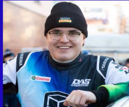
immagine profilo Facebook